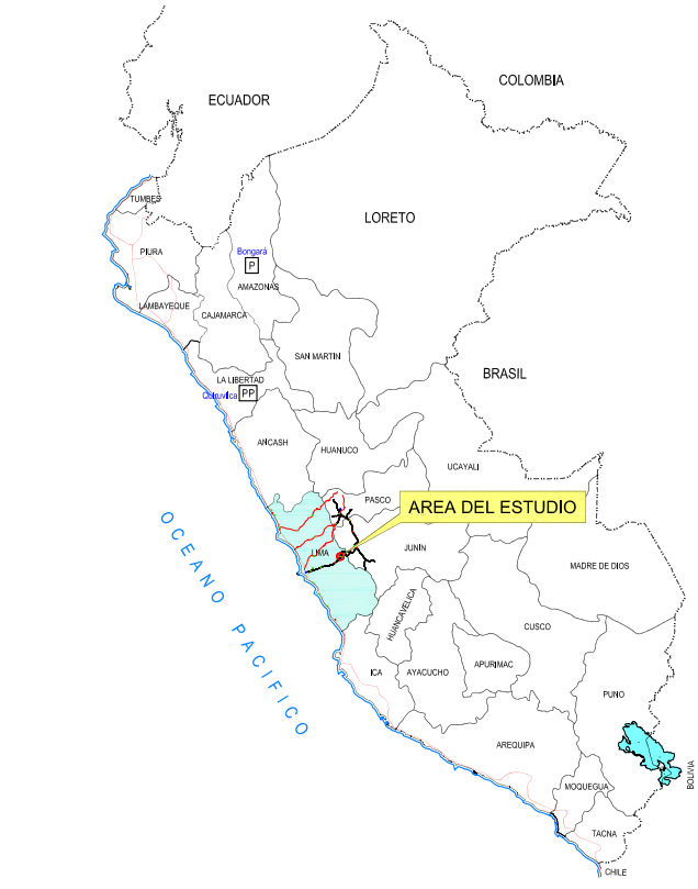
PLANO DE UBICACIÓN NACIONAL